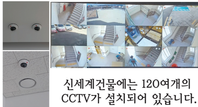
신세계건물에는 120여개의 CCTV가 설치되어 있습니다.