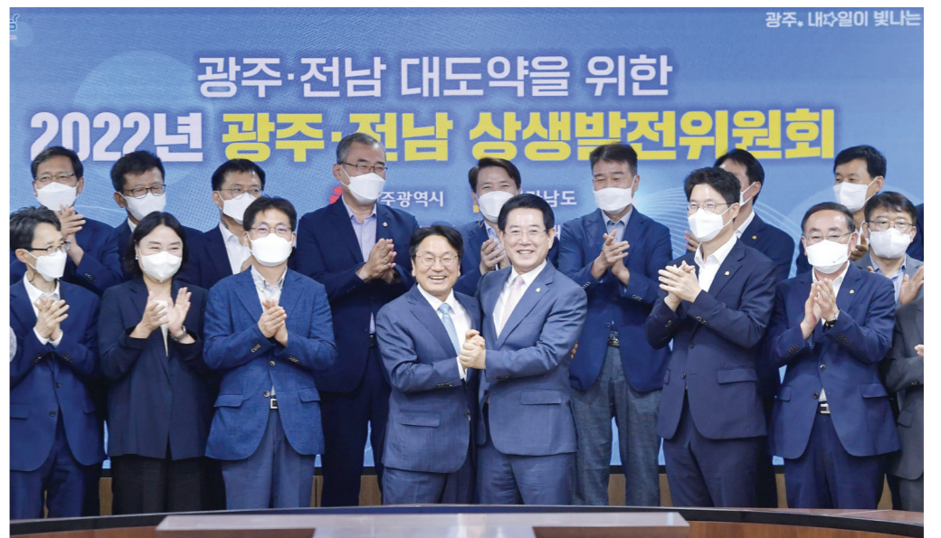
강기정 광주시장과 김영록 전남지사가 7월28일 오전 전남도청 서재필실에서 열린 '2022년 광주·전남 상생발전위원회'에 참석해 양 시도 실·국장들과 기념촬영을 하고 있다.

사무 발굴, 집행기관·의회 설치 계획수립·추진, 민관협의·홍보활동 등에 집중하게 된다. 준비단 구성 절차는 광주·전남 실무협의(2022년 7~8월)→시·도 협약·의회 포함(9월)→한시기구 행정안전부 승인·관련 조례개정(행정기구 설치조례·정원조례·10월)→합동 추진단 발족·운영(2022년 11월~2023년 11월) 순으로 진행될 계획이다. 광주·전남 특자체는 향후 시·도의회의 의결을 거쳐 규약 합의를 도출한 다음 행정안전부 승인 절차까지 마무리 되면 본격 출범하게 된다. 전남도 관계자는 "특별지방자치단체는 지방자치법 개정에 따라 2개 이상의 지자체가 공동으로 사무를 처리할 필요가 있을 때 설립하는 것으로 문재인 정부에서 처음으로 시작돼 현 정부에서도 유지되고 있다"고 설명했다. 이 관계자는 이어 "전남·광주 특자체 설립의 궁극적인 목표는 산업과 인재육성이라는 큰 틀에서 조광역협력 체계를 구축하는 것인 만큼 시·도의 공동 번영을 위해 설립 준비에 만전을 기하겠다"고 덧붙였다. 한편 특별지방자치단체는 앞서 지난 2019년 경남도가 공식 제안한 이른바 '부울경 메가시티'가 집행력을 가진 행정기구로 첫 발을 내딛은 게 시발점이다. 이후 경남도는 지난 4월 부산, 울산이 함께 하는 전국 최초의 특별지방자치단체인 '부산울산경남특별연합'을 출범시켰다.