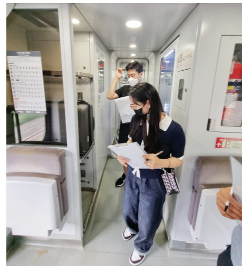
수 있도록 최선을 다하겠습니다. 동부취재본부김승호기자

한국철도공사 광주전남본부는 2022년 5기 고객평가단과 합동으로 추석 대수송 대비 열차 이용 고객들의 안전한 여행을 위한 역·열차를 대상으로 합동 안전점검을 시행했다. 철도공사 광주전남본부는 이번 추석 연휴기간 이용객이 증가할 것으로 예상되는 광주송정역, 순천역 등 주요역 및 열차를 대상으로 진행했다는 것. 고객평가단과의 합동점검을 통해 고객 시선에서 열차 이용 간 안전 위해요소, 열차 이용 간 불편사항 등을 사전 발굴하여 선제적으로 조치할 예정이다. 철도공사 광주전남본부 관계자는 “이번 합동점검을 통해 추석 대수송 기간 중대 시민재해 예방 및 고객의 편안하고 즐거운 여행이 될