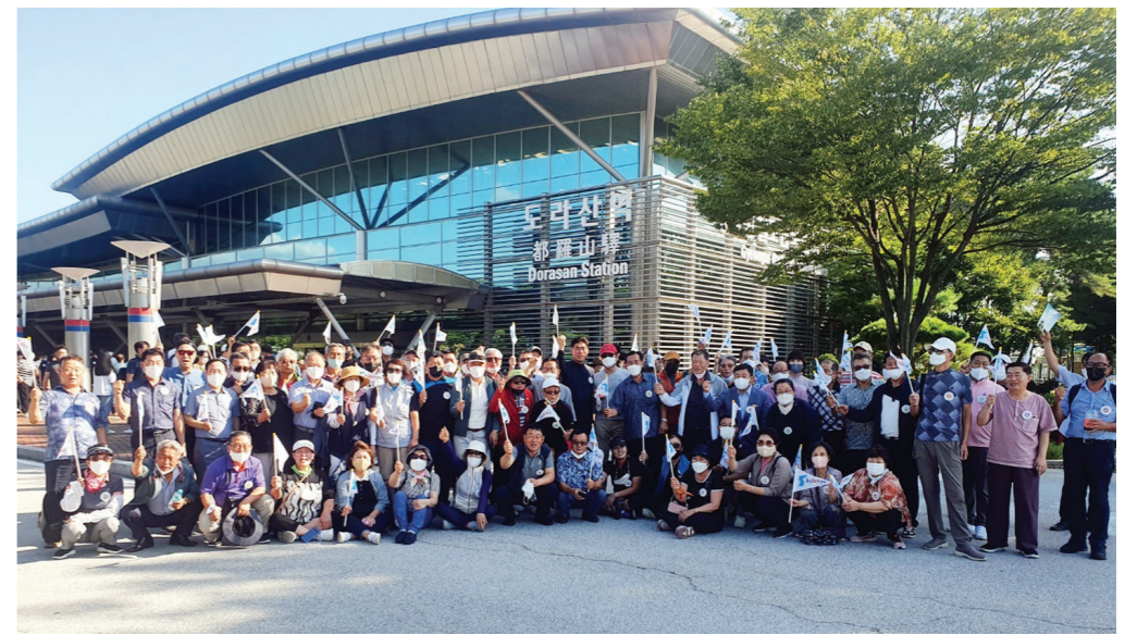
도라산역에 도착한 통일희망열차 참가자들.