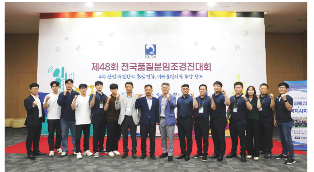
2022년 전국품질분임조경진대회에서 역대 최고의 성과를 거둔 한전KPS 4개 분임조 조원들이 기념촬영을 하고 있다.