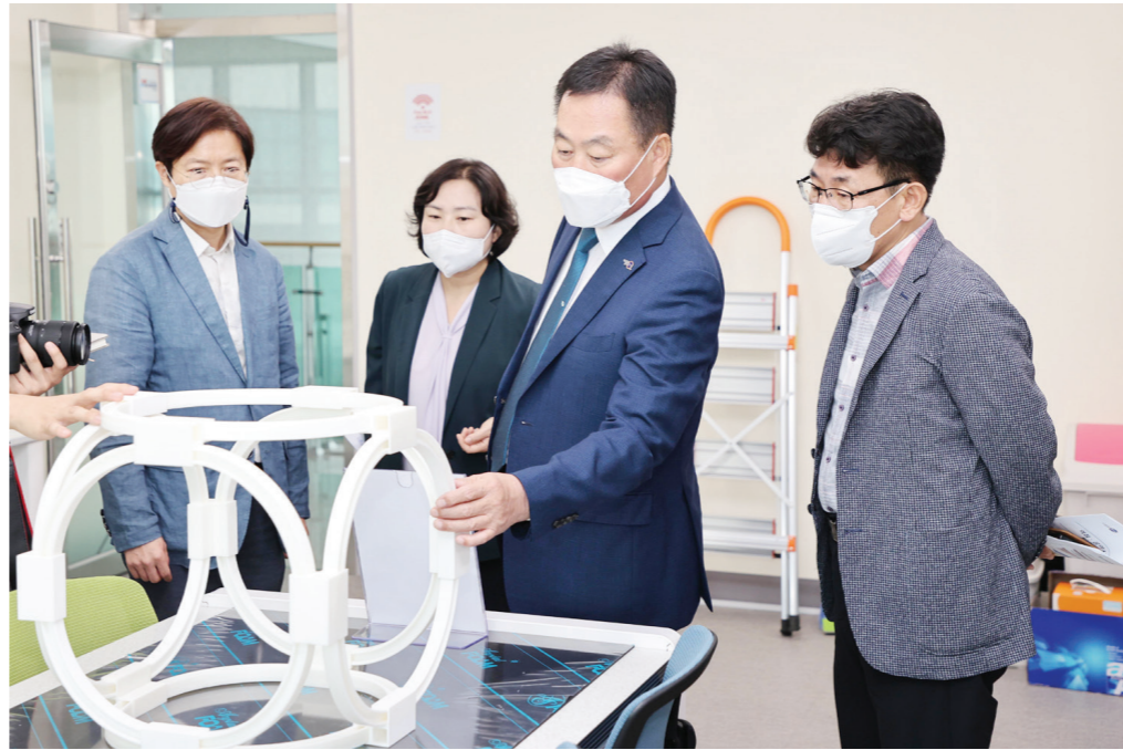
집 건립 등 수십개의 굵직굵직한 현안사업을 추진하고 있다. 무안=이기성기자

앞으로 김산 군수는 기본일정을 수행하면서 주요 공약·역점사업장에 대한 지속적인 현장 점검을 통해 임기 내 사업 완성도를 높이는 데 주력할 계획이다. 김산 군수는 현장점검에서 “메이커스페이스 전문랩 개소로 우리 무안군은 4차 산업기술을 융합한 스마트팜 산업 제조창업 생태계 구축에 유리한 고지를 선점했다”며 “앞으로 메이커스페이스를 통해 지역내 청·장년, 중소기업들이 실질적인 도움을 받을 수 있도록 적극적인 홍보와 운영에 힘써 달라”고 주문했다. 한편 민선8기 무안군은 첨단농업복합단지 조성, 메이커스페이스 구축, 무안을 복합문화센터 건립, 남악·오룡 체육시설 인프라 확충, 오룡 복합문화센터 건립, 남악청소년 문화의