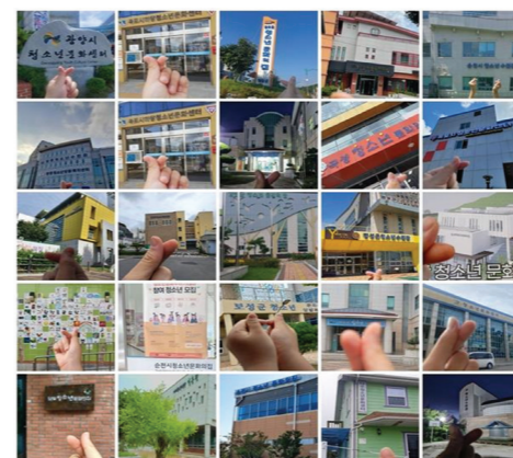
22개 시·군 청소년이 함께하는 비대면 걷기 챌린지