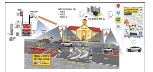
광주시 스마트 횡단보도 시스템(ITS) 구축 방안 모식도.