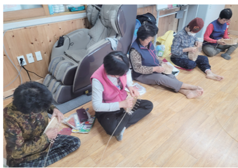
담양군은 인구의 고령화와 만성질환 증가 등으로 한방 의료에 대한 관심과 수요가 증대됨에 따라 마을 경로당을 중심으로 진행하는