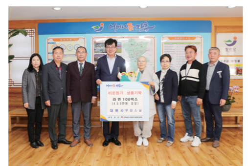
동센터 연합회 회장은 “따뜻한 나눔에 깊이 감사드립니다”며, “기부해주신 물품은 지역아동센터 아동들을 위해 소중히 사용하겠다”고 말했다.