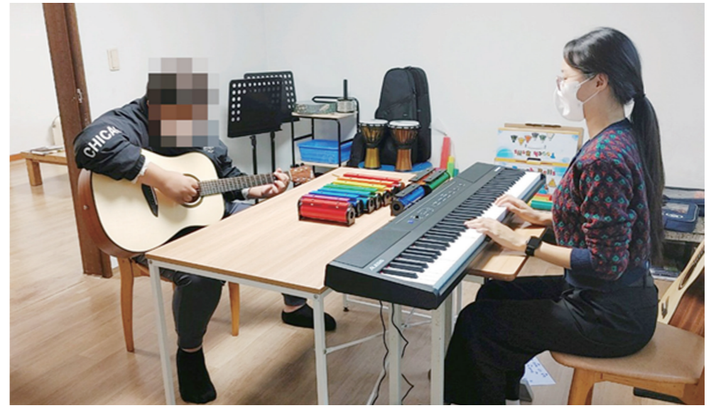
광산구는 추후 경과를 살펴 치료 연장 및 대상 확대를 적극 검토할 계획이다. 투게더광산 나눔문화재단도 아동·청소년의 정서 안정과 건강한 심리발달을 위해 꾸준한 지원을 약속했다.

아동·청소년의 적극적인 참여로 활발하게 진행 중인 음악치료 프로그램은 내년 9월까지 이어질 예정이다.