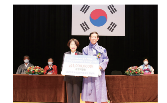
4천만 원의 인재육성기금이 조성됐다고 밝혔다.

한편, 강진군민장학재단은 올해 1억 6천 5백만 원의 장학금이 모였으며 현재까지 172억