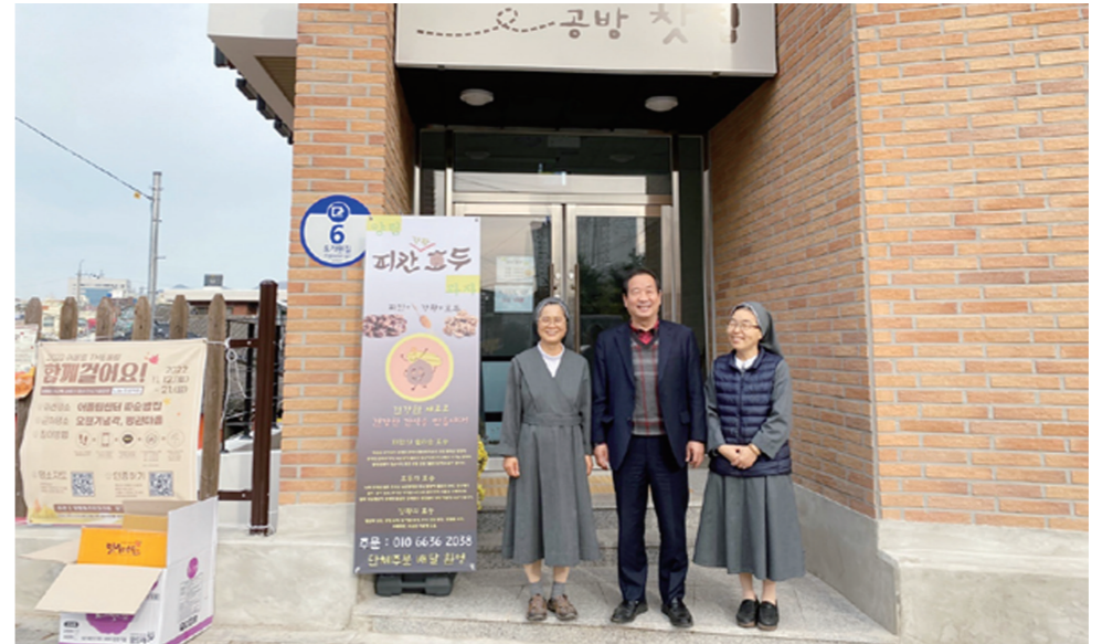
자들에게 공공서비스를 제공하는 많은 역할을 할 것으로 기대된다"며 "사업 제안과 실천에 나서준 양림동 마을관리 사회적협동조합과 까리파스 수녀회에 감사의 말씀 올린다"고 밝혔다. 유유나기자

이와 함께 양림동 마을관리 사회적협동조합과 까리파스 수녀회에서는 따순밥집 아래층인 1층에 주민공유 공방찻집을 마련, 커피와 수제정, 레몬차, 복숭아차 등 각종 음료를 1,000원에 판매하고 있다. 휴식이 필요한 청년 및 주민들에게 따순밥집과 공방찻집 공간을 내주고, 이곳에서 각종 고민에 대한 상담도 진행하기 위해서다. 남구는 협동조합 초기 사업비를 통해 따순밥집과 공방찻집이 안정적으로 운영되도록 식기세척기와 냉장고, 테이블, 사무실 운영비를 제공하고, 양림동 특화상품인 피칸 호두과자 제조기 구입비 등을 지원할 계획이다. 또 해당 공간을 2년간 무상으로 제공해 따뜻한 한끼 식사 등이 지속적으로 이뤄질 수 있도록 했다. 남구 관계자는 "따순밥집과 공방찻집은 마을공동체 회복을 비롯해 지역 내 사회적 약