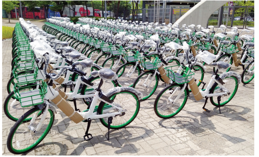
광주시 무인 공공자전거 ‘타랑께’.

산을 자전거타기 좋은 도로여건 개선 등에 투자하는 것이 더 효과적”이라고 제안했다. 이에 대해 오영걸 광주시 공공교통국장은 “도입 초창기여서 어려움이 많은데 이용자층을 확대하기 위해 개선 보완 중이고 일단은 민간보다는 공공 영역에서 진행해 나갈 방침”이라고 말했다. 이어 “자전거는 통학이나 통근, 건강 등 다양한 목적으로 이용되고 있다”며 “다양한 이용자층의 요구에 맞춰 효율을 극대화하는 동시에 인프라 확충과 여건 개선에도 행정력을 모을 계획”이라고 덧붙였다. 등·하교 때 학생들이 자전거를 자유롭게 이용할 수 있도록 시교육청과 협의해 보겠다는 의견도 나왔다. 간편결제도 앱 개발사와 협의 중이다. 한편 타랑께는 ‘타라니까’라는 뜻의 전라도 방언으로, 2020년 7월부터 상무지구를 중심으로 자전거 350대, 주차장 51개소로 시작된 공공자전거 대역사업이다. 1000원의 이용료로 90분간 이용할 수 있어