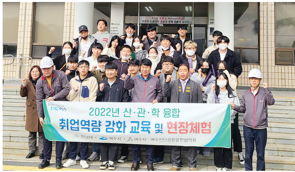
여수시와 전남대 관계자는 "앞으로도 청년들이 지역 내에서 꿈을 키우고 좋은 일자리를 얻을 수 있도록 다양한 프로그램을 발굴하는

공발협 김신 사무국장은 "코로나19와 기업 사정 등으로 현장 방문이 쉽지 않은 상황인데도 프로그램에 적극 협조해주신 금호석유화학에 감사드린다"며 "이번 교육으로 지역 대학생의 진로 설정과 취업역량 강화에 많은 도움이 되었기를 바란다"고 전했다.