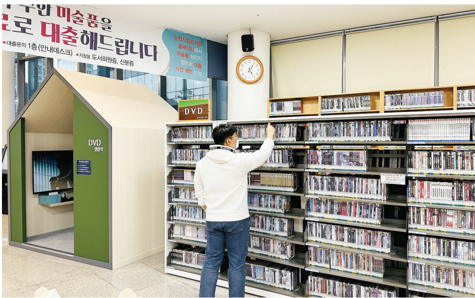
순천시는 순천시립삼산도서관을 이용하는 시민들이 더 편안한 환경에서 도서관을 이용하고 다양한 콘텐츠를 즐길 수 있도록 도서관 공간을 새롭게 꾸몄다고 밝혔다.

도서관 내 독서공간 개선 및 DVD 열람석 조성 “이용 시민들 쾌적한 환경서 더 나은 경험 하길”