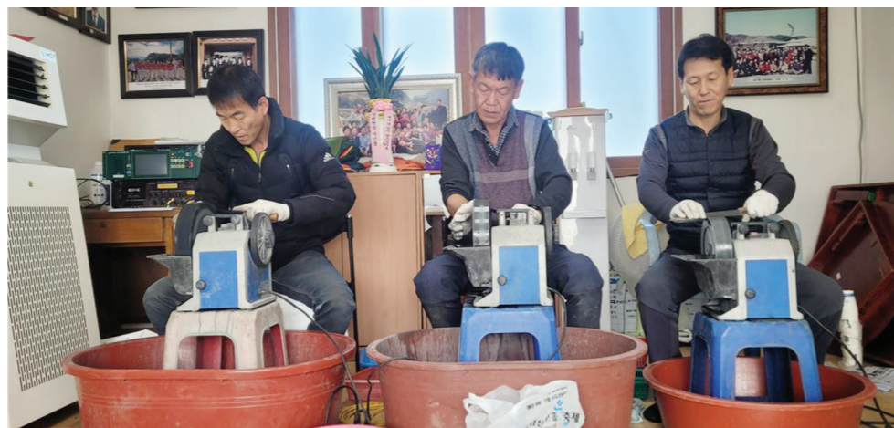
장흥군 장평면농민회원들이 시골 마을을 찾아 무료로 칼과 가위를 갈아주는 봉사에 나섰다. 농민회에서 진행되는 무료 칼갈이 봉사는 1월 3일부터 19일까지 진행되고 있다. 이번 칼갈이 무료 봉사는 용두농협에서 장흥=김도영 기자