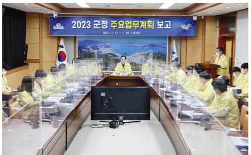
완도군은 지난 1월 12일 군청 상황실에서

군수, 부군수, 부서장, 팀장 등이 참석한 가운데 '2023 군청 주요 업무 계획 보고회'를 개최했다. 보고회는 17일, 18일까지 3일간 실시되며, 민선 8기 새로운 도약을 위한 중요한 시기에 총 413건의 부서별 중점 추진 사업 및 신규 사업 계획을 점검하고 문제점과 개선 방향을 논의하기 위해 마련됐다. 먼저 신 군수는 "지난해 국내외적으로 어려운 상황 속에서도 적극적으로 행정을 펼쳐 국