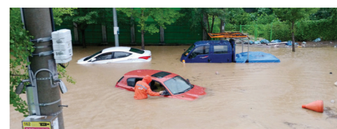
지난 2020년 8월 7일 광주 북구 문흥동 문흥성당 주변 일대 차량이 빗물에 침수돼 있다.

반영해 지원한다. 우수 흐름이 좋지 않은 하수관에 대해서도 퇴적물 준설과 빗물 유입구 정비, 유입구 추가 설치 등을 지원·추진, 침수 피해를 차단한다는 계획이다. 이를 위해 올해 상반기 자치구 지원사업 25건에 53억 원을 들여 노후관로 등을 정비한다. 또 하수도 수선유지비 44억 원 중 41억 원을 투입하는 등 침수피해 예방사업 등에 총 94억 원의 예산을 조기 투입할 예정이다.