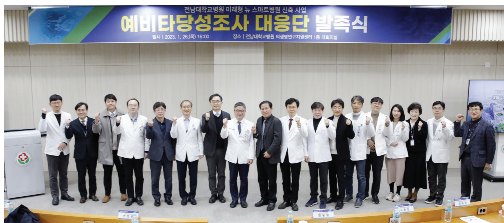
전남대병원은 지난 26일 광주 동구 학동 본원 의생명연구지원센터에서 ‘미래형 뉴 스마트병원 신축 예비타당성 조사 대응단’ 발족식을 가졌다고 29일 밝혔다.