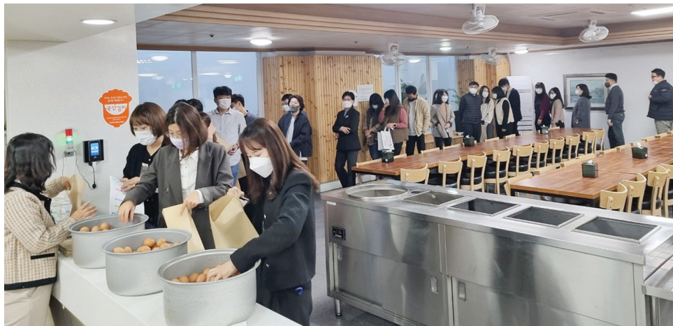
행복하게 직장생활을 해야 대민서비스 질이 향상될 것”이라며 “앞으로도 직원들의 사기 진작과 활기찬 직장 분위기 조성에 앞장서겠다”고 말했다.