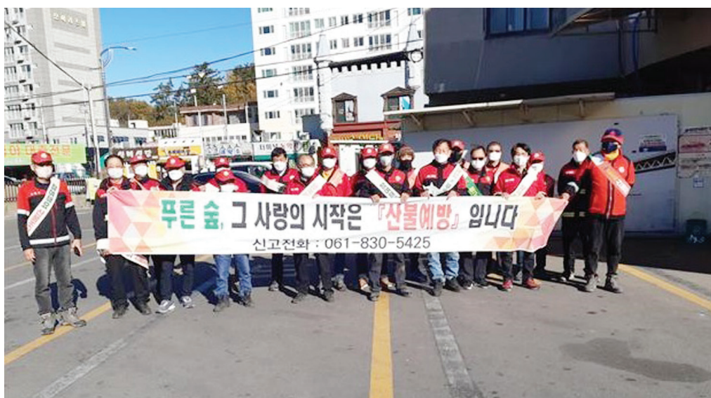
고흥군은 봄철 산불 조심기간 운영에 따라 군청과 16개 읍면에 산불방지대책본부를 설치하고 본격 운영에 들어갔다고 1월30일 밝혔다. 겨울철 계속된 건조한 날씨와 강한 바람으로 인하여 산불발생 위험이 커짐에 따라 군은 1월 20일부터 5월 15일까지 ‘봄철 산불 조심기

또한 입산자 실화를 방지하기 위해 운암산 등 관내 10개산 8,198ha를 입산통제구역으로 지정, 고시했다. 이밖에도 산불진화대원 30명, 읍면 산불진화대원 및 산불감시원 62명을 배치하는 등 봄철 산불 대응체제를 가동했으며, 산불진화용 헬기 1대를 임차해 산불 발생시 10분 이내에 신속하게 출동할 수 있도록 초기 진화체계도 구축했다. 군 관계자는 “산불 대부분은 산림 인접지인 논, 밭두렁 소각과 쓰레기 소각 등으로 많이 발생하는 만큼, 산불예방에 관한 군민들의 많은 관심과 세심한 주의가 필요하다”고 말했다. 고흥=기동취재본부