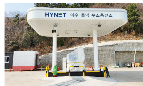
동되면 수소차 보급 확대에도 큰 역할을 할 것"이라며 "대기환경 개선을 위해 미래 친환경 에너지원인 수소경제 활성화에 더욱더 힘을 쏟을 것"이라고 전했다. 한편, 여수시는 2022년까지 수소승용차 400대를 보급했으며, 올해는 수소승용차 235대, 수소버스 11대를 보급할 계획이다. 여수=김현근 기자

여수시 중흥동 1호 수소충전소에 이어 2호 '하이넷 여수 둔덕 수소충전소'가 22일부터 본격 운영된다. '하이넷 여수 둔덕 수소충전소'는 좌수영로 617(둔덕동)에 위치한 일반승용 수소충전소로 민간사업자인 ㈜수소에너지네트워크가 환경부의 수소충전소 설치 공모사업에 선정돼 국비 15억 원을 포함, 총 30억 원을 투입해 구축했다. 수소충전소 운영시간은 오전 8시부터 오후 8시까지(매주 월요일 휴무) 시간당 최대 승용차 5대 가량 충전이 가능하며, 충전금액은 kg당 9900원이다. 시는 오는 5월에는 상용차 전용 3호 수소충전소를 추가 구축·운영할 예정으로 수소차 이용자들의 편의가 더욱 증진될 것으로 보인다. 시 관계자는 "올해 2, 3호 수소충전소가 가