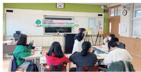
사회연계 협의체 운영, 현장 사례 나눔 T/F, 집단프로그램 등을 지속 운영할 예정이다. 영광=서희권기자

영광교육지원청은 학교폭력 예방 및 건강한 학교 문화 조성을 위하여 담당교사 연수, 지역