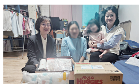
르기 좋은 장흥군을 만들 것"이라고 말했다. 장흥=김도영기자

층 산모의 부담을 완화하고 출산 친화적인 지역 분위기 조성에 도움이 될 것으로 기대하고 있다. 오는 6월 출산 예정인 임산부는 "출산용품이 생각보다 비싸서 부담이 됐는데 꼭 필요하고 예쁜 출산 용품을 지원받아 너무 감사하다"고 고마움을 전했다. 김성 장흥군수는 "장흥군드림스타트 사업을 통해 출산을 축하하고 지원하는 다양한 지원책을 마련하겠다"며, "앞으로도 아이 낳고 기