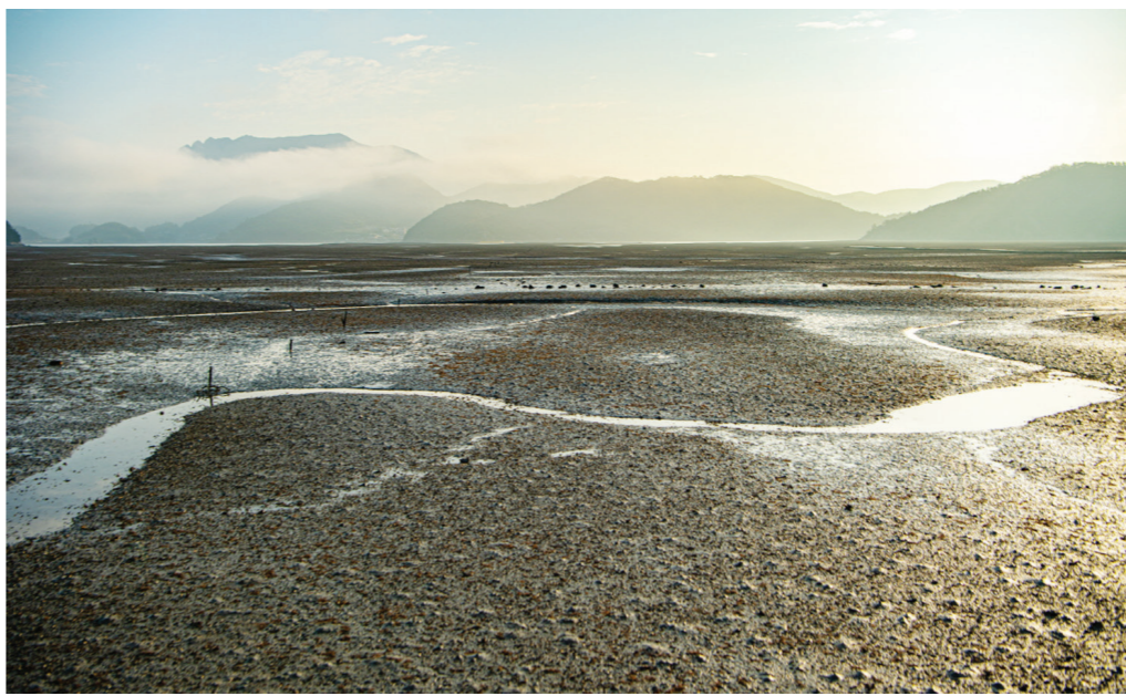
세계유산에 등재될 수 있도록 노력하겠다고며 "고흥의 청정 갯벌 보호와 보전을 위해 군민들

공영민 고흥군수는 "해양수산부, 문화재청, 세계유산 추진단과 긴밀하게 움직여 2단계도