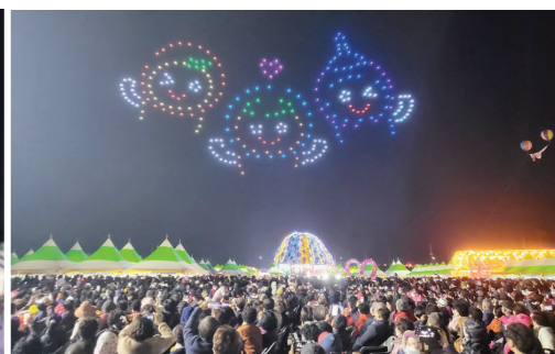
풍 등 기상상황에 따라 공연이 연기되거나 취소될 수 있으니, 사전에 고흥군 대표홈페이지 등을 통해 공연 일정을 확인해 줄 것"을 당부했다. 고흥=기동취재본부