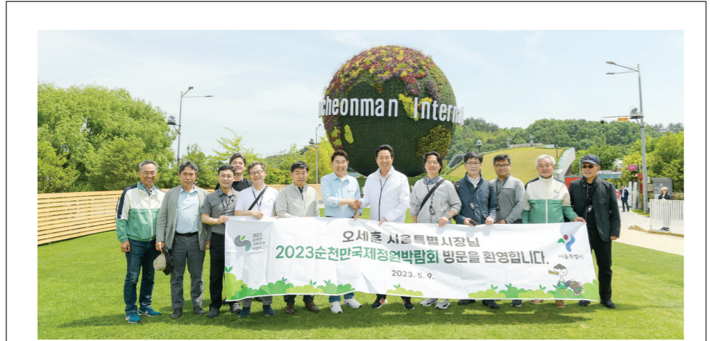
오세훈 서울시장과 서울시 공무원들이 9일 순천만정원박람회장에서 기념촬영을 하고 있다.