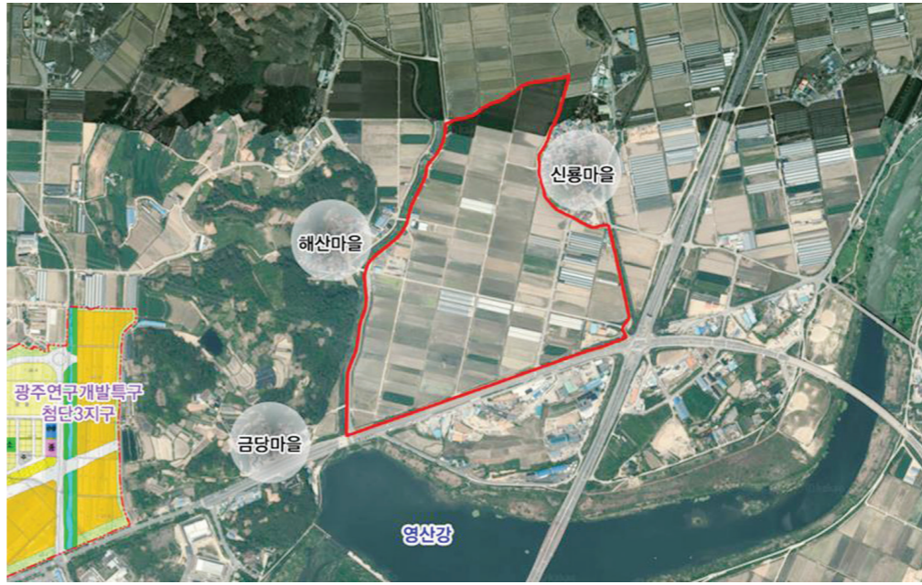
광주 의료특화산업 조성 예정 지역.

의료특화 산업단지는 지역기업의 영세성 극복을 위해 인공지능과 데이터 중심의 광주연구개발특구(첨단3지구·첨단과학산업단지)와 연계한 새로운 산업기술과 융합 고도화로 새로운 비즈니스 영역을 구축하고, 고부가 산업으로 전환을 위한 생태계 조성의 취지를 담고 있다. 기존 제조방식에 AI·디지털·의료 융합 등을 접목한 미래 먹거리 확보를 위해 디지털의료 분야 신도기업, 연구개발센터, 강소·중견·중소·벤처·창업기업을 유치할 계획이다. 광주시는 의료특화산업단 조성을 통한 경제적 파급효과를 생산 1546억 원, 부가가치 671억 원, 소득유발 379억 원, 신규 일자리 1200여 명으로 분석했다. 이계두 광주시 투자산단과장은 "광주 의료산업은 2021년 기준 500여 개의 기업과 1조 2600억 원의 매출, 직접고용 4500명의 성과로