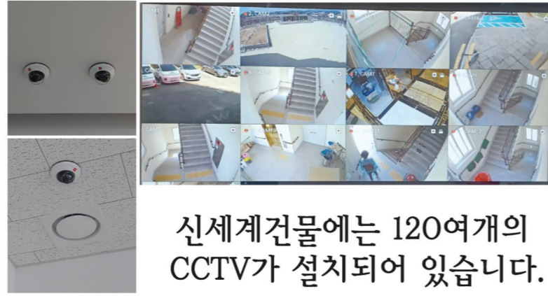
신세계건물에는 120여개의 CCTV가 설치되어 있습니다.