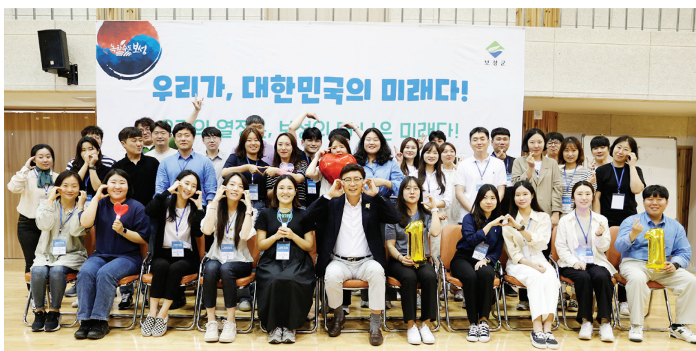
보성군의 주역이 될 공직자 여러분들과 이렇게 소통의 시간을 갖게 되어 기쁘게 생각한다. "라며 "앞으로도 변화하는 환경에 발맞추고 조직 내 갈등 예방을 위한 소통 프로그램을 다양하게 지원할 것"이라고 밝혔다. 보성=김덕순기자

특히, 직원들과 다양한 프로그램을 함께한 김철우 보성군수는 소통의 시간을 통해 MZ세대 직원들과 격의 없이 다양한 의견을 나눠 큰 호응을 얻었다. 교육에 참여한 이 모 직원은 "서로에 대한 이해와 존중이 있어야 당당하게 일할 수 있다는 것을 느낄 수 있는 소중한 시간이었다."라며 "보성의 더 나은 미래를 위해 열심히, 즐겁게 일할 수 있도록 최선을 다하겠다."라고 말했다. 김철우 보성군수는 "대한민국의 미래이고