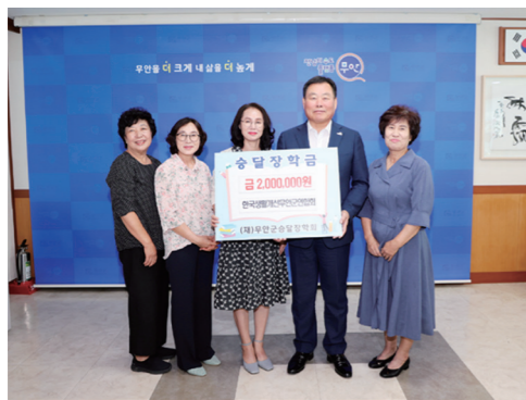
한국생활개선무안군연합회가 지난 16일 지

역인재 양성에 써달라며 (재)무안군승달장학회에 장학금 200만 원을 맡겼다. 장학금은 지난 7월에 개최한 제26회 무안연꽃축제 동안 현장에서 향토음식점을 운영하여 발생한 수익금으로 마련했다. 한편 한국생활개선무안군연합회는 지난 5월에도 무안전통시장서 운영한 먹거리 판매부스 수익금 270만 원을 맡기는 등 지속적인 나눔 활동으로 지역사회에 본보기가 되고 있다.