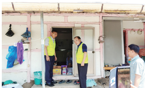
영암군 학산면지역사회보장협의체가, 최근 홀몸 어르신, 장애인 등 취약계층 가정 52곳에 여름나기 물품을 나눴다.