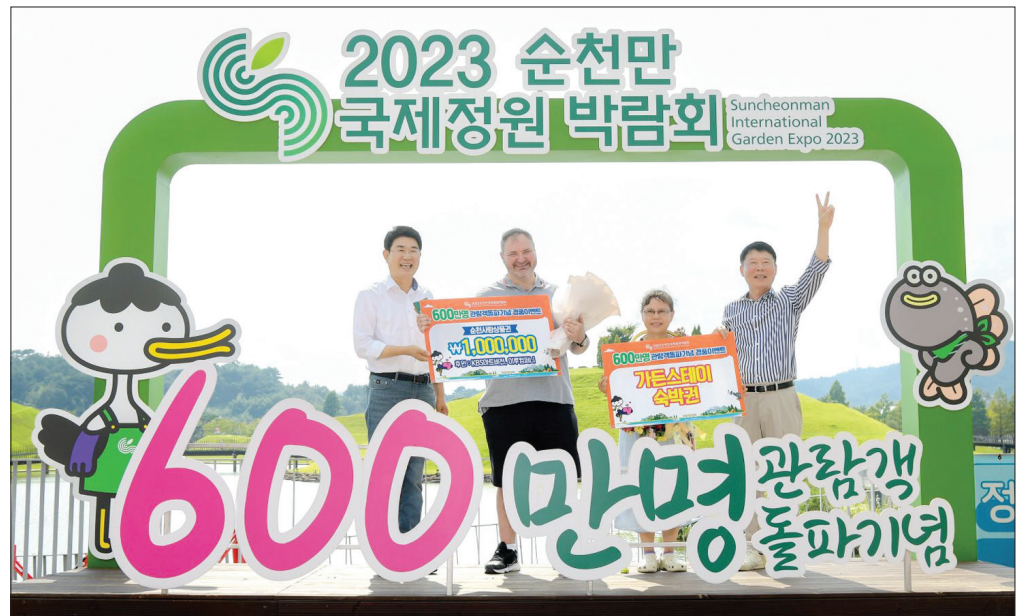
27일 (재)순천만국제정원박람회조직위원회(이사장 노관규, 순천시장은)가 순천만국가정원 호수정원 나루터에서 600만 관람객 맞이 기념행사를 하고 있다.

쉽지 않았다. 그런데 600만 번째 관람객으로 선정되면서 가든스테이 숙박권을 받게 된 것이 무엇보다 기쁘다. 가장 큰 선물과도 같다"며 소감을 전했다. 조직위는 600만 번째 입장객 축하 행사에 이어 지난 7일 순천만국가정원 어린이동물원에서 출생한 아기 다람쥐원숭이 '몽순'을 소개했다. '몽순'은 원숭이를 뜻하는 영어 Monkey의 '몽'과 순천의 '순'자를 조합한 이름으로, 전국민 대상 공모전을 실시해 내부 심사와 박람회 관람객 선호도 조사를 통해 최종 선정됐다. 노관규 이사장(순천시장은)은 '몽순'을 대신한 원숭이 캐릭터에 이름표를 직접 걸어주며, 어미 원숭이의 산후조리와 몽순이의 건강을 위해 바나나를 선물했다. 이날 조직위는 축하공연과 함께 경품 추첨 이벤트를 열어 박람회 입장권을 비롯해 기념품 및 팔라온지 농산물 선물꾸러미 세트 등을 관람객들에게 선물하기도 했다. 한편 순천만국제정원박람회는 지난 6월 23일 500만 관람객 돌파 이후 약 2달여 만에 600만 관람객을 넘어서며 흥행을 이어가고 있다.