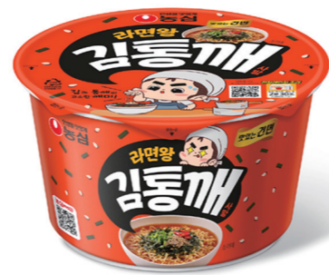
농심은 라면왕김통개의 컵라면 신제품 '라면