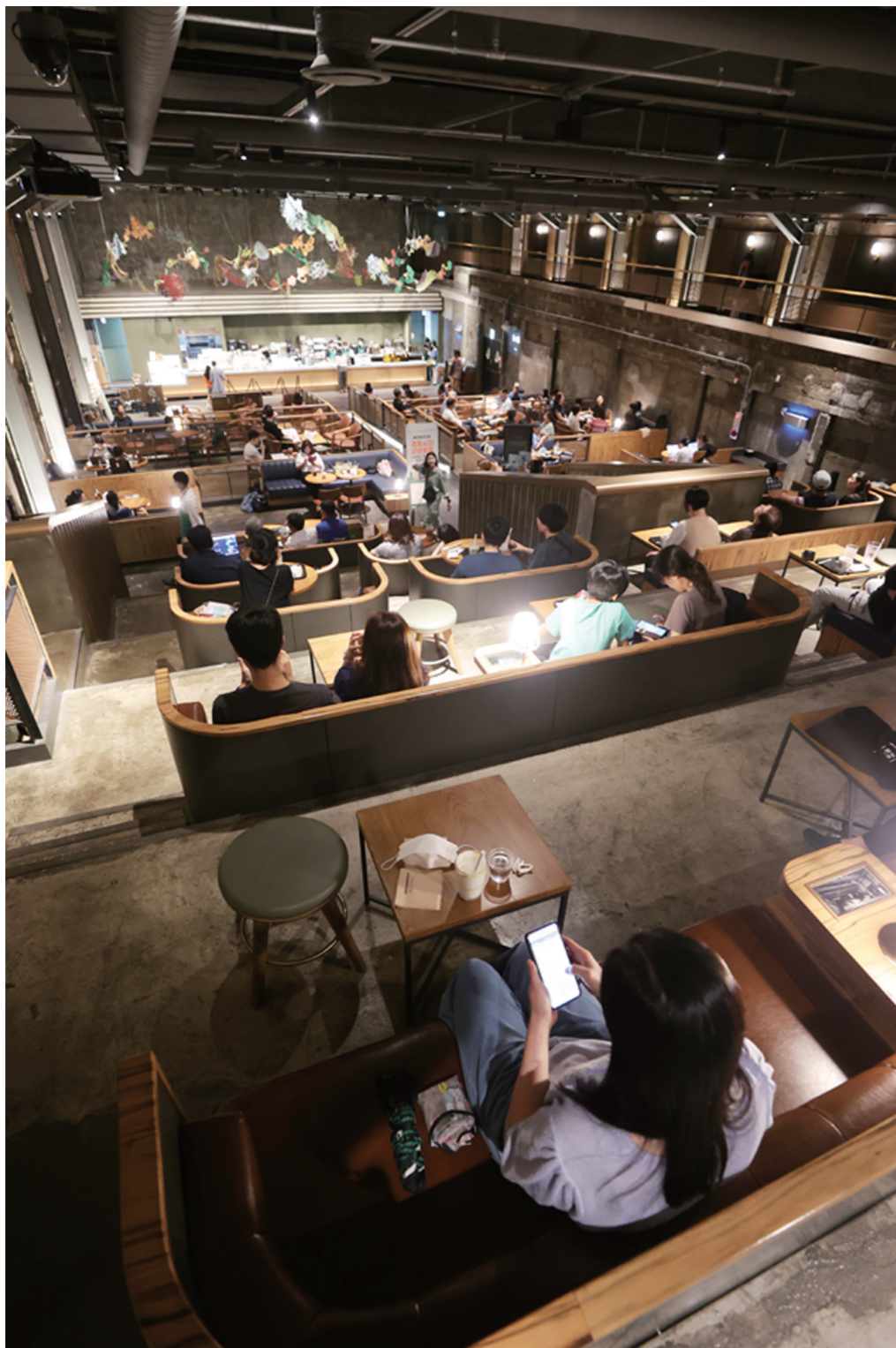
옛 극장의 카페 변신, 전통시장 활성화 이끈다

했으나, 여행 및 교통서비스(25.1%), 음·식료품(13.5%), 화장품(16.9%) 등에서 증가했다. 상품군별 모바일쇼핑 거래액 구성비는 음식서비스(16.4%), 음·식료품(13.3%), 여행 및 교통서비스(10.4%) 순으로 높았다. 상품군별 모바일쇼핑 거래액 비중은 음식서비스(98.4%), 아동·유아용품(82.4%), 애완동물(81.8%) 순으로 높았다. 전년동월대비 가전·전자(3.0%p) 등에서 증가했으나, 이쿠폰서비스(-7.7%p), 문화 및 레저서비스(-4.5%p) 등에서 감소했다. 변용일 기자