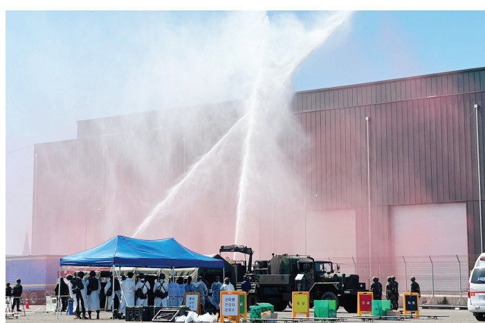
광양시는 지난 7일 광양항 변전소 일대에서 을지자유방패(UFS)훈련과 연계해 핵 공격 후 사후관리에 대한 통합훈련을 전개했다. 150명이 참여했다. 훈련은 여수시 국가산단 내 핵무기 공격이 감행돼 낙진 및 방사능 노출 등 후속효과에 의

이번 훈련은 민·관·군·경 소방의 가용장비와 인력을 동원해 시민 생활 안정을 도모함과 함께 기관별 통합 방위 태세를 갖춰 대응하는 제반 활동을 숙달, 강화하고자 이뤄졌다.