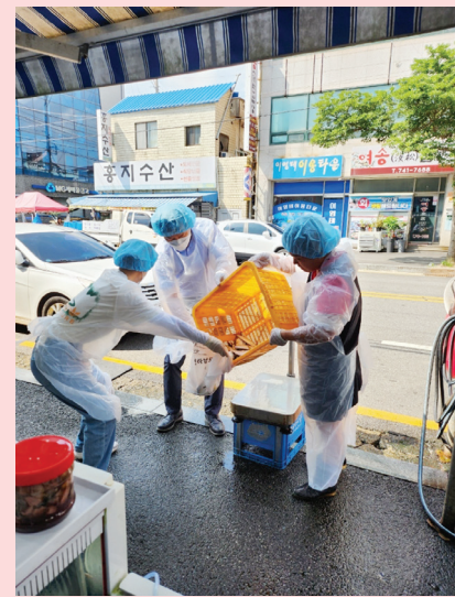
순천시, 추석에 수산물 안심하고 드셔도 됩니다 소비위축 예방 위해 안전성 검사 강화

순천시는 추석을 앞두고 9월 한 달간 시민들의 건강 보호와 소비 위축 예방을 위해 수산물의 안전성 검사를 강화하기로 했다고 밝혔다.