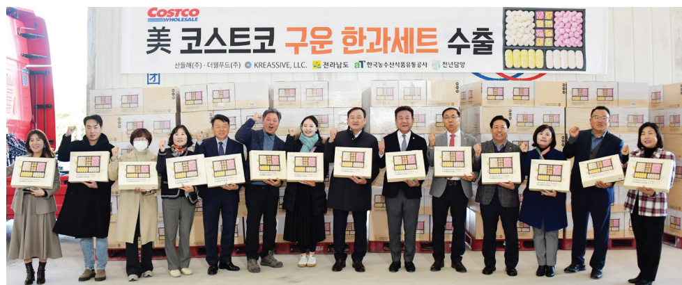
담양 전통한과 미국 코스트코 수출 상차식

미국 현지인들의 입맛을 사로잡은 담양 전통한과 선물세트가 크리스마스를 앞두고 미