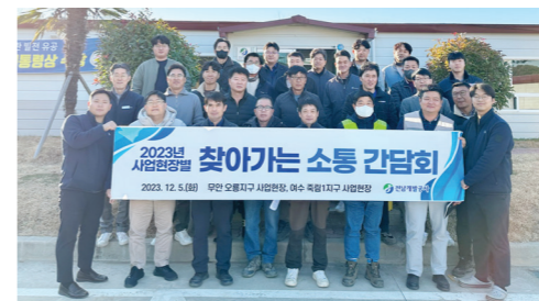
검사 시 부조리를 사전에 차단하고 불편사항을 최소화 하기 위해 기성, 준공검사시 업체의 건의사항과 애로사항을 청취했다.

특히 간담회에서는 계약이행에 따른 주의사항, 대금청구 간소화 절차 등 업체들이 필요로 하는 정보를 서로 공유하는 시간을 가졌으며,