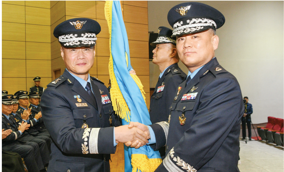
공군 제1전투비행단은 12월 6일 기지 내 강당에서 제52대, 53대 단장 이취임식을 거행하였다. 김준호 공중전투사령관이 변성은 취임 단장에게 지휘권을 상징하는 부대기를 이양했다. (좌: 김준호 공중전투사령관, 우: 변성은 제1전투비행단장)