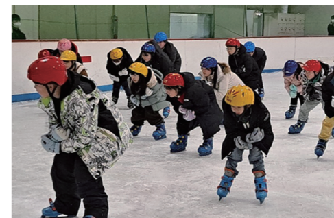
인으로 성장하길 바란다.

백양초 학생들의 견학과 체험을 통한 지식과 경험들이 사고를 확장시키고, 예술은 어렵고 지겹다 느끼지 않고 가까이 있음을 인지하여 일상에서 문화예술을 향유할 수 있는 문화