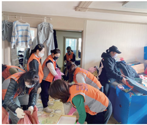
광주 광산구(구청장 박병규)가 최근 민간 단