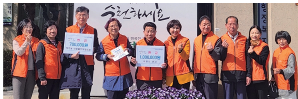
또한 덕연동 마중물보장협의체는 갑상선암이 폐로 전이되어 현재 항암치료 중으로 가족들로부터 도움을 받지 못하고 병원비와 교통