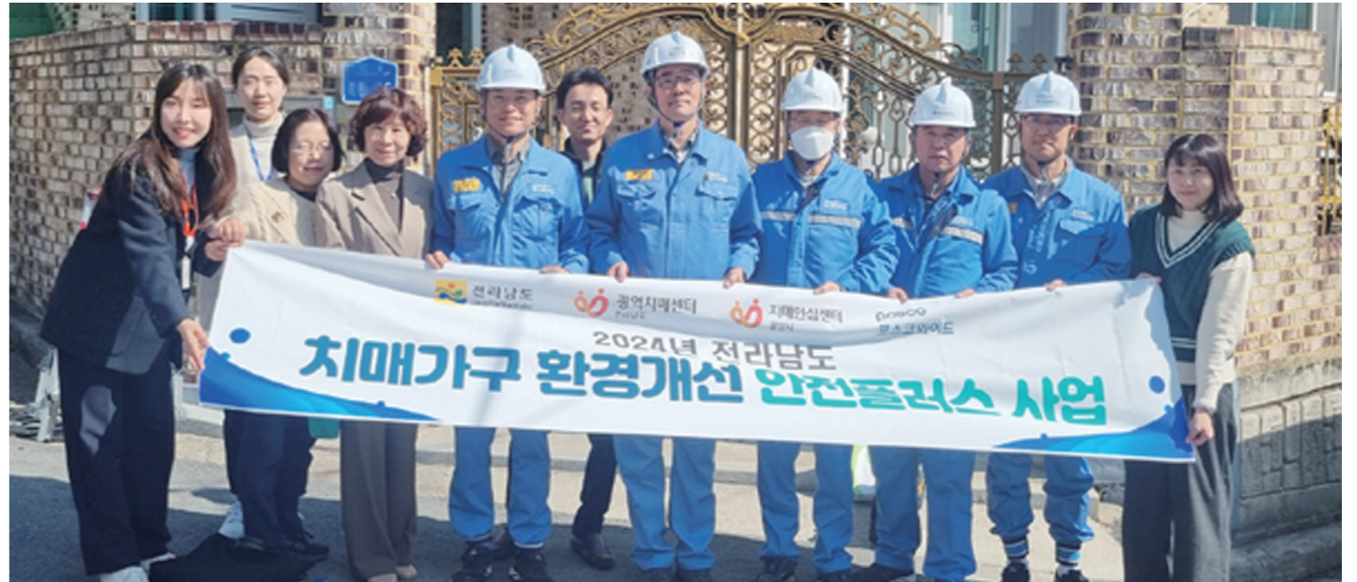
는 맞춤형 서비스 제공으로 생활 속 안전 확보에 큰 도움이 될 것으로 기대된다”며 “앞